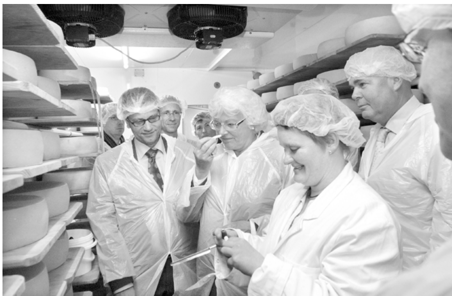
Um auf die Bedeutung der Diversifizierung für die landwirtschaftlichen Betriebe und die ländliche Entwicklung hinzuweisen, wurde die EU-Kommissarin Mariann Fischer Boel nach Hohenlohe eingeladen. Ihre Reise durch die Region führte sie auch in die Dorfkäserei Geifertshofen.

An die 1997 als private Initiative gegründete Dorfkäserei in Geifertshofen liefern derzeit elf in einer Erzeugergemeinschaft organisierte Biobetriebe. Die Nachfrage nach dem Käse ist so groß, dass die Erzeugung ausgedehnt werden könnte, aktuell jedoch nicht genug Biomilch am Markt verfügbar ist. Insgesamt wurden in den vergangenen sechs Jahren 24 neue Stellen geschaffen, vorwiegend Teilzeitstellen bzw. auf 400-Euro-Basis.