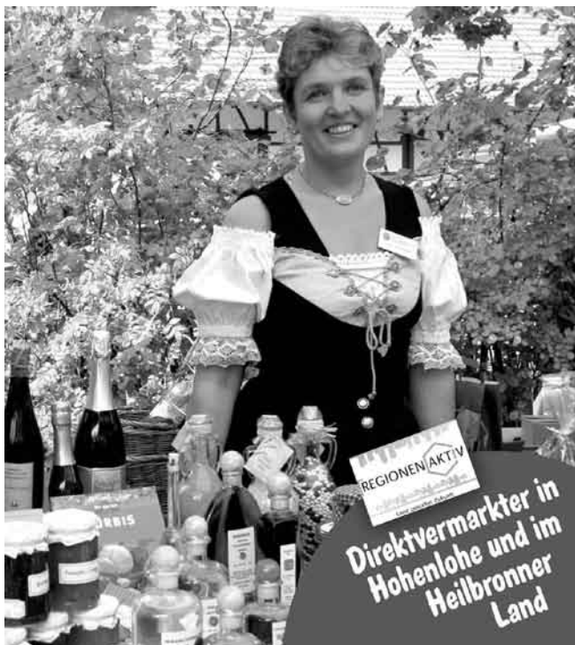
Die Direktvermarktung ist nur ein Bereich neuer Wertschöpfung auf den Höfen.