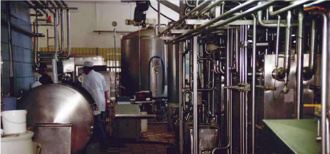
Die Upländer Bauernmolkerei im Innern, zehn Jahre später. Die Kapazitäten der Molkerei werden voll ausgeschöpft, der Nachfrage nach Upländer Bauernmolkerei-Produkten ist kontinuierlich gewachsen.

lag und die sich deutlich gegen die Schließung der Upland Molkereiausgesprochen hatte, war leicht für diesen Plan zu begeistern. Die Vertreter des touristischen Ortes erhofften sich neben der sozialen Wirkung auch eine Attraktivitätssteigerung ihrer Region über die Produkte eines heimischen Unternehmens mit Qualitätserzeugung.