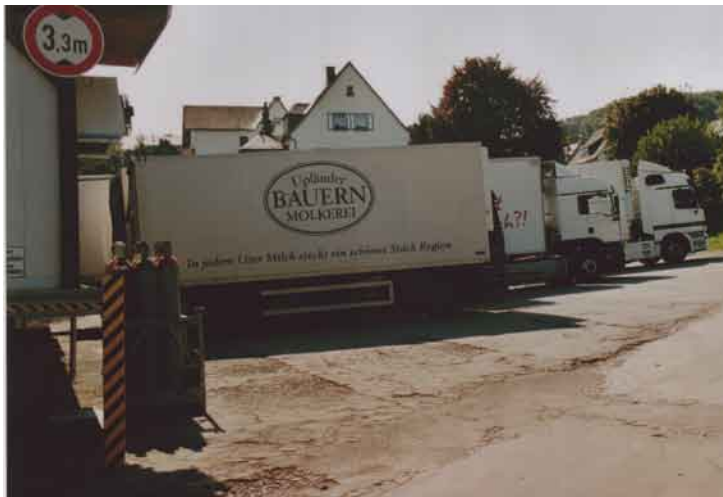
Der Fuhrpark der Bauernmolkerei im Jahr 2006.

Die Upländer Bauernmolkerei ist ein lebendiges Beispiel dafür, dass es durchaus möglich ist, die Strategien von Lissabon im Einklang mit den in Göteborg erarbeiteten Strategien umzusetzen. Die im Juni 2005 von den Staats- und Regierungschefs der EU formulierten Leitprinzipien der nachhaltigen Entwicklung mit ihrer Maxime, dass sich wirtschaftliche, soziale und ökologische Ziele gegenseitig verstärken können, findet in dieser Molkerei eine vorbildliche Umsetzung. In der Erklärung heißt es: Es sollen gleiche Wettbewerbsbedingungen ge-